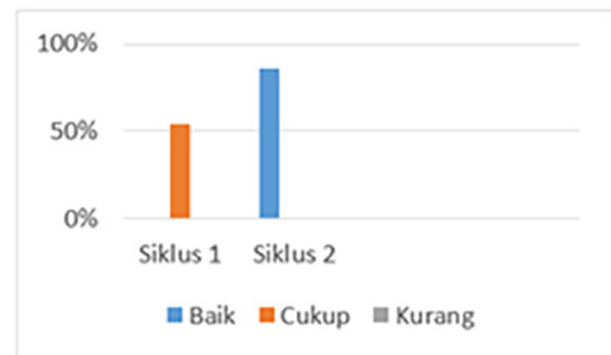
Table 1.1. Hasil Skor kreativitas setiap kelompok setelah penerapan proyek infografis dari siklus I hingga siklus II